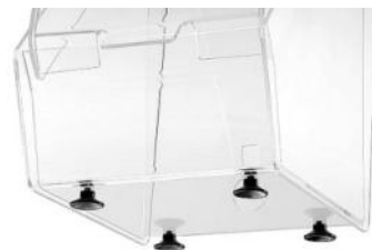
4 Saugnäpfe für sicheren Stand