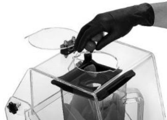
Öffnung oben mit Verschlusskappe