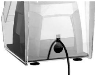
Öffnung für Kabelausgang