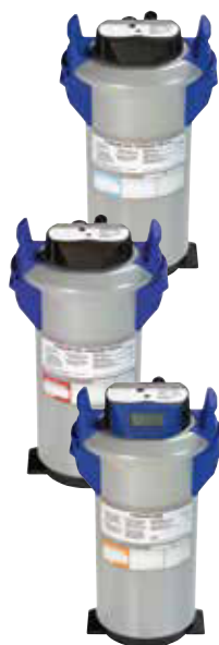
Teilentsalzung HYDROLINE STAR PD

Die Teilentsalzung entzieht dem Rohwasser den Anteil an Mineralien, der für die Karbonathärte verantwortlich ist. Dadurch ist sie für das Gläserspülen geeignet, wenn die Karbonathärte im Rohwasser einen sehr hohen Anteil an der Gesamthärte aufweist. Für das Geschirrspülen ist sie uneingeschränkt geeignet.