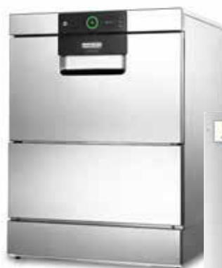
Umkehrosmose HYDROLINE PURE RO-I