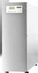
Umkehrosmose HYDROLINE PURE RO-S