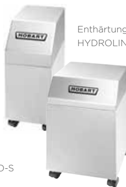
Enthärtungsanlage HYDROLINE PROTECT SD-H