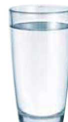
VOLLENTSALZTES WASSER/ OSMOSEWASSER