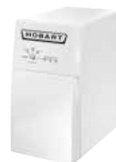
Enthärtungsanlage HYDROLINE PROTECT SE-H